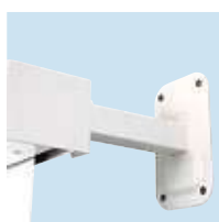
Wandabstandträger Beschreibung siehe Seite 92