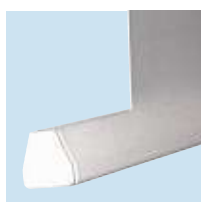
Konischer Beschwerungsstab für bündigen Abschluss mit dem Gehäuse