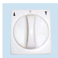
Unterputz-Drehschalter (im Lieferumfang)